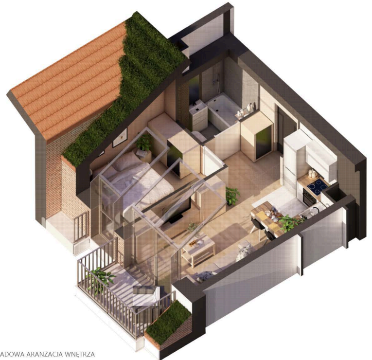
PRZYKŁADOWA ARANŻACJA WNĘTRZA

MARINA RESIDENCE PUCK ul. Aleja Lipowa 4 84-100 Puck