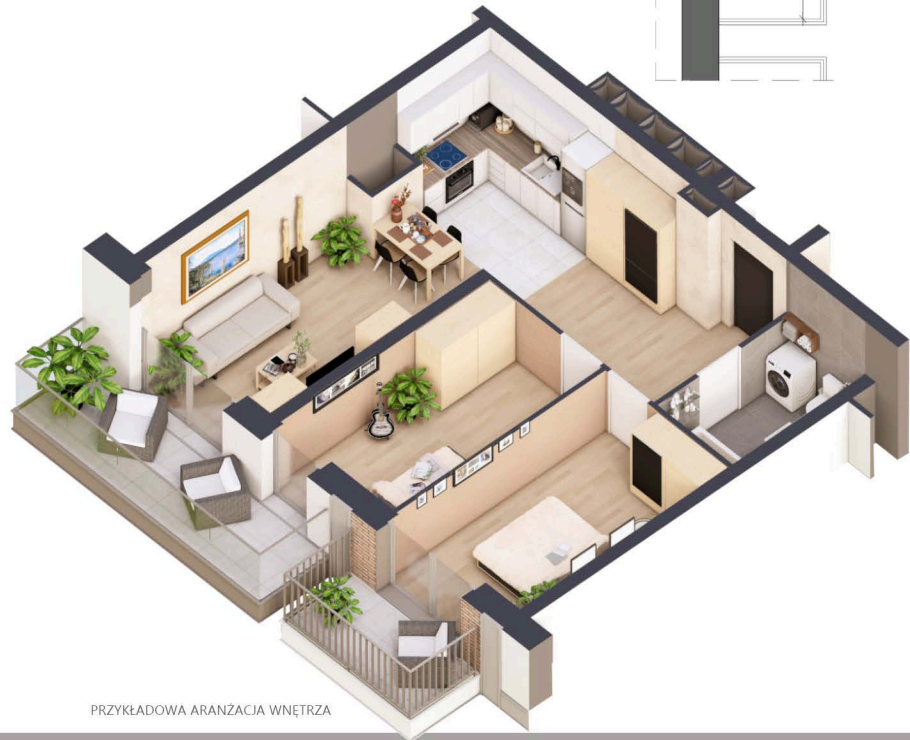
PRZYKŁADOWA ARANŻACJA WNETRZA

MARINA RESIDENCE PUCK ul. Aleja Lipowa 4 84-100 Puck