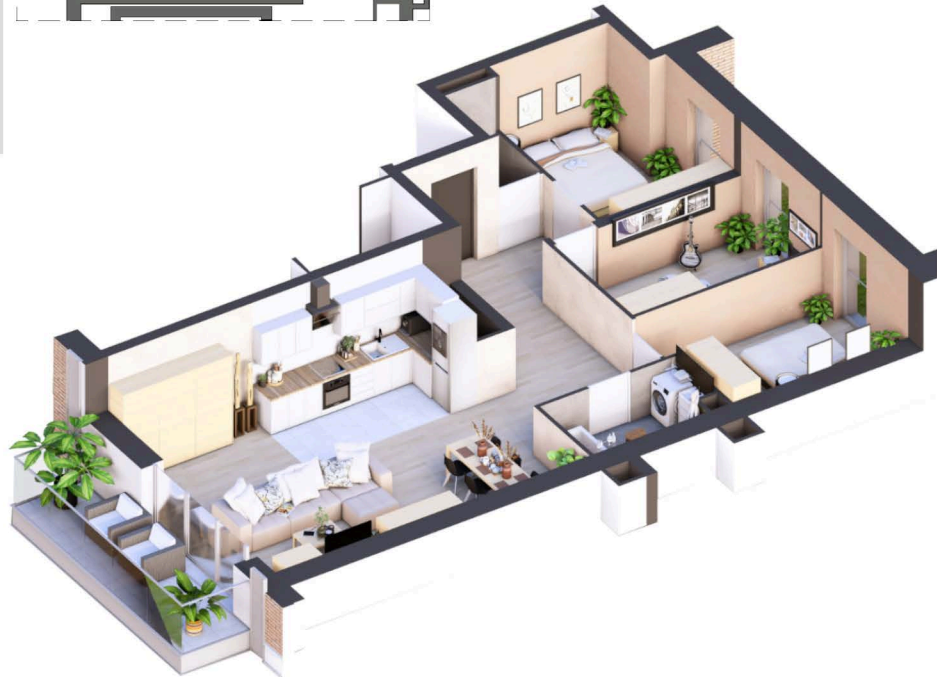
PRZYKŁADOWA ARANŻACJA WNĘTRZA

MARINA RESIDENCE PUCK ul. Aleja Lipowa 4 84 – 100 Puck