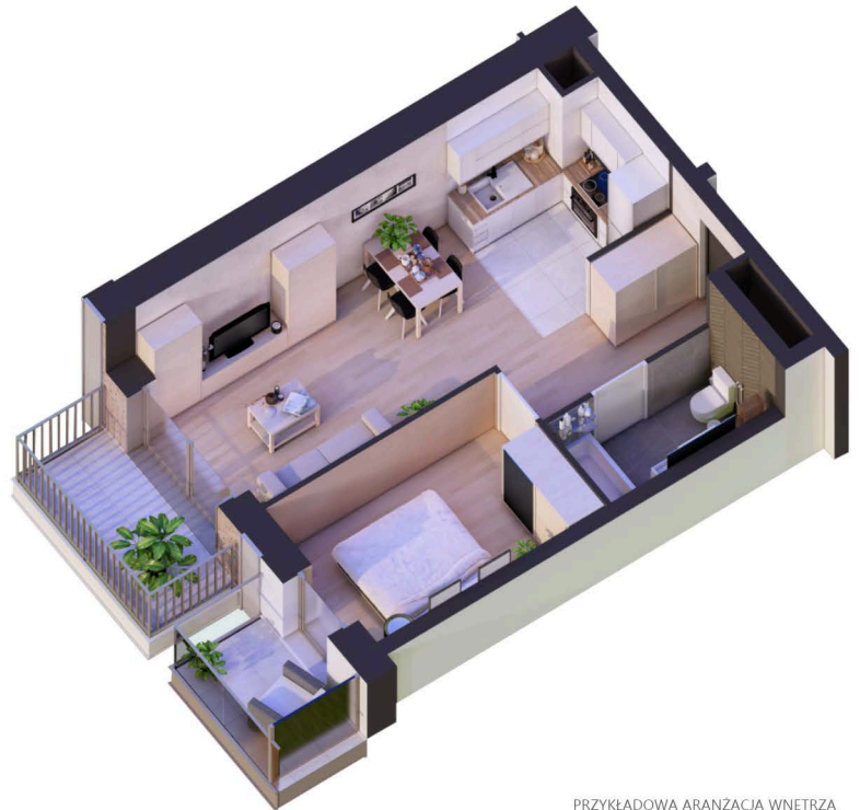
PRZYKŁADOWA ARANŻACJA WNĘTRZA

MARINA RESIDENCE PUCK ul. Aleja Lipowa 4 84-100 Puck