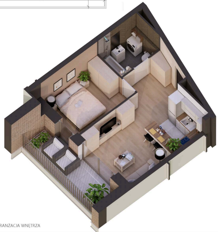
PRZYKŁADOWA ARANŻACJA WNĘTRZA